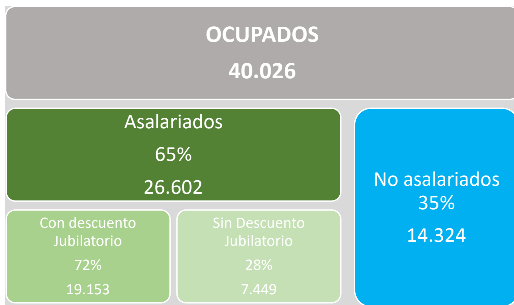
Cuadro 2. Caracterización de los ocupados. Año 2022. Venado Tuerto.

Fuente: Relevamiento sobre Mercado de trabajo. Diciembre 2022. MVT. Base: 511 individuos ocupados.