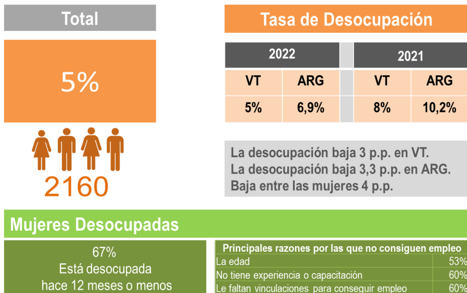
Cuadro 1. Tasa de Desocupación Total. Comparación entre mediciones y a nivel nacional.