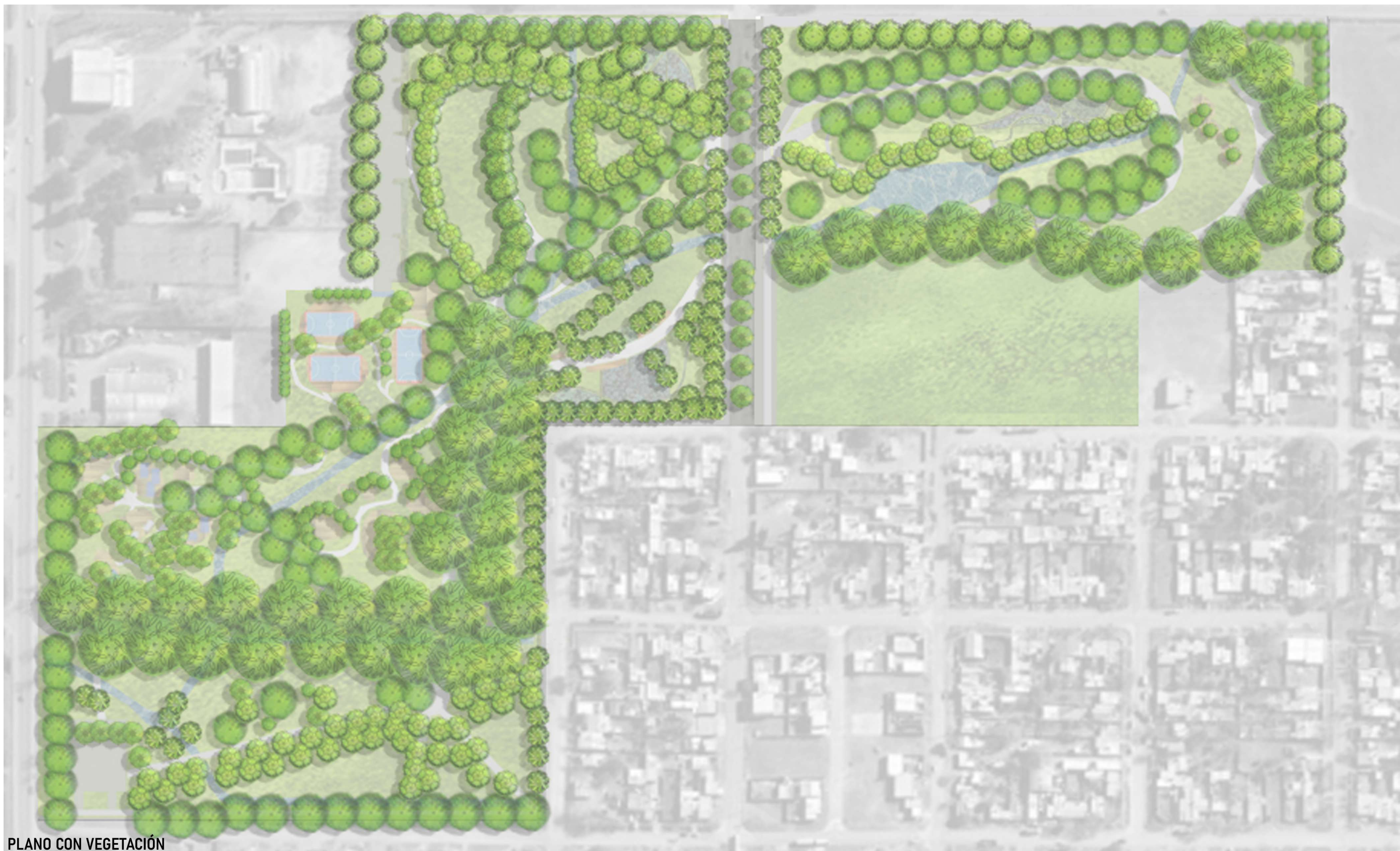
PLANO CON VEGETACIÓN