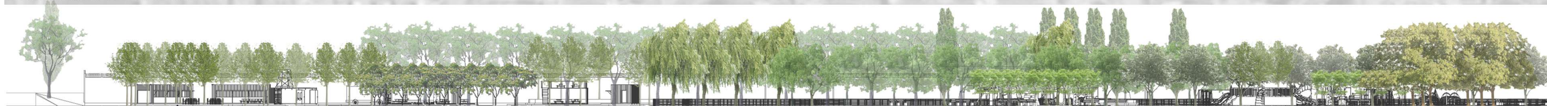
CORTE CON VEGETACIÓN